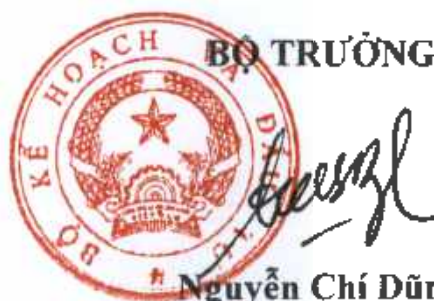
Nguyễn Chí Dũng