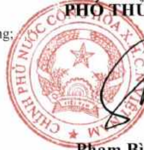
Phạm Bình Minh

TM. CHÍNH PHỦ KT. THỦ TƯỚNG PHÓ THỦ TƯỚNG